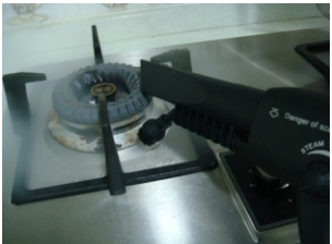
ЧИСТИТ И ОБЕЗЖИРИВАЕТ

Если вы живете в местности с жесткой водой, используйте дистиллированную воду во избежание образования накипи, которая будет оседать на очищаемой ткани и во избежание известкового налета на внутренней части прибора. Важно: Прибор может работать и с жесткой водой, но известковый налет будет образовываться на нагревательных элементах и вокруг клапанов, чтобы удалить его, хотя бы раз в месяц используйте раствор уксуса с водой для очистки прибора.