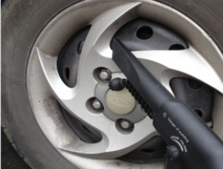
ОЧИЩАЕТ ДЕТАЛИ АВТОМОБИЛЯ