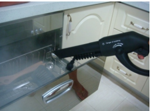
ЧИСТИТ ДУХОВКУ И ГРИЛЬ