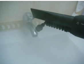
ЧИСТИТ КРАНЫ В ВАННОЙ И НА КУХНЕ