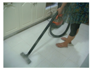
ЧИСТИТ И ПЫЛЕСОСИТ ПОЛ